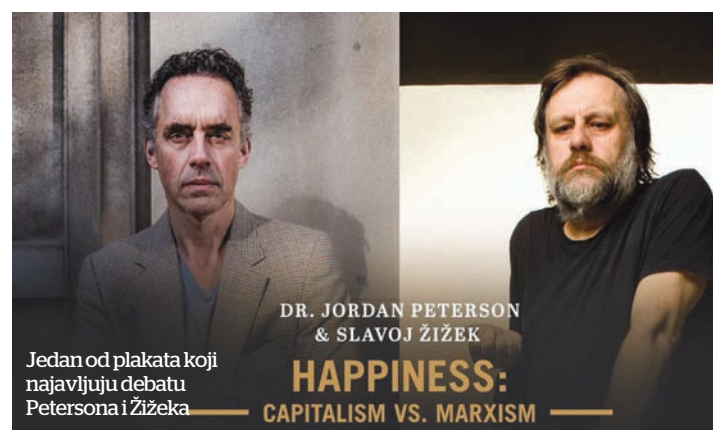
Jedan od plakata koji najavljuju debatu Petersona i Žižeka

Peterson je odgovarao tako što je tvitovao da će se susresti sa