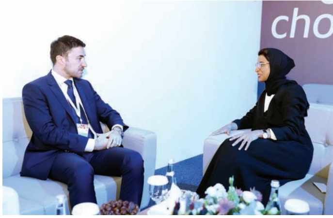
Aleksandar Bogdanović i Noura Al Kaabi na Samitu kultura

Ministar Bogdanović na samitu u Abu Dabiju