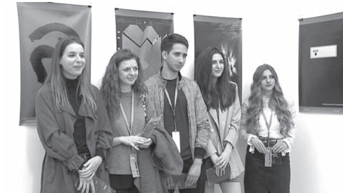
Sa dodjele nagrada na Cetinju